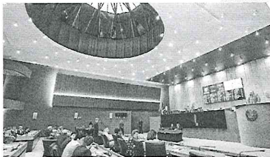
Presidente da Alepe prometeu colocar em pauta o projeto relativo às emendas

A LDO define metas e prioridades da administração pública estadual, estabelecendo as regras que serão seguidas pela Lei Orçamentária Anual (LOA) - entre elas, as normas de indicação e execução de emendas parlamentares. Essa questão específica foi alvo do discurso do líder oposicionista ao tratar da PEC 4/2019, a qual, além de aumentar a reserva para essas emendas, também prevê sanções ao gestor público que não executar os valores indicados pelos deputados. "Essa proposta não aumenta um centavo a mais no orçamento, mas permite que a lei orçamentária não seja um